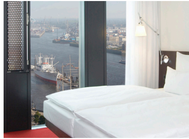
Zimmer „Riverside“ / rooms