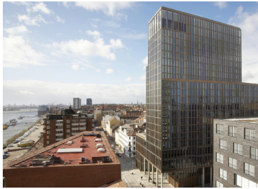
Hotellansicht / hotel view