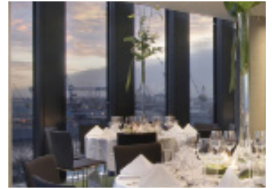
„Conference 3C + 3D“