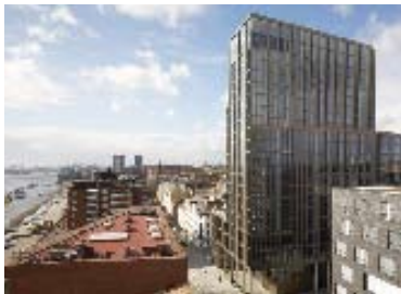
Hotellansicht / hotel view