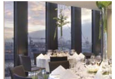
„Conference 3C + 3D“