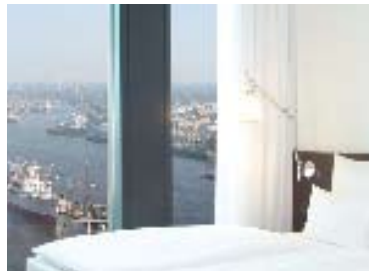
Zimmer „Riverside“ / rooms